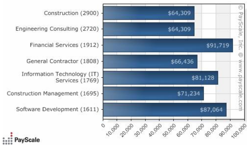
Σχήμα 4: Μέση αμοιβή ανάλογα με τον κλάδο απασχόλησης