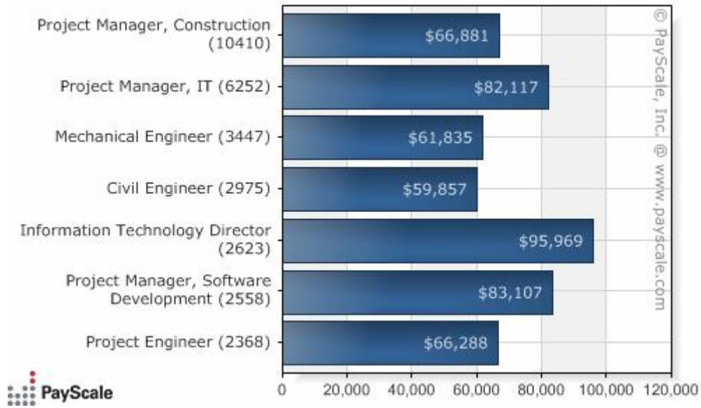
Σχήμα 3: Μέση αμοιβή ανάλογα με τον τίτλο της θέσης εργασίας