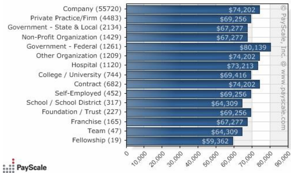
Σχήμα 2: Μέση αμοιβή ανάλογα με τον τομέα απασχόλησης